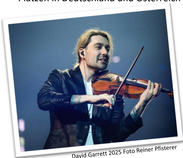
David Garrett 2025

Ein weiteres spannendes Kapitel in der Karriere von David Garrett hat mit der Veröffentlichung seines Albums Millennium Symphony, das die Tophits der letzten 25 Jahre in frappierende Klangbilder verwandelt, begonnen. Nach einer ausverkauften Arena-Tour mit seiner Band und Orchester setzt er die Erfolgsstory fort und ist im Sommer 2026 in den schönsten Open Air-Plätzen in Deutschland und Österreich live zu erleben.