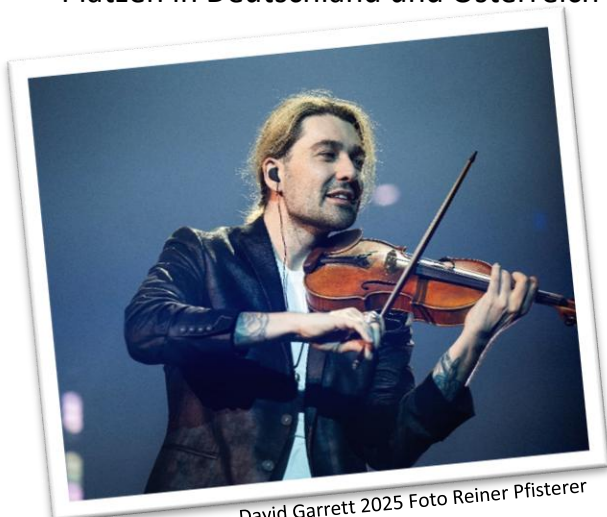
David Garrett 2025

Ein weiteres spannendes Kapitel in der Karriere von David Garrett hat mit der Veröffentlichung seines Albums Millennium Symphony, das die Tophits der letzten 25 Jahre in frappierende Klangbilder verwandelt, begonnen. Nach einer ausverkauften Arena-Tour mit seiner Band und Orchester setzt er die Erfolgsstory fort und ist im Sommer 2026 in den schönsten Open Air-Plätzen in Deutschland und Österreich live zu erleben.